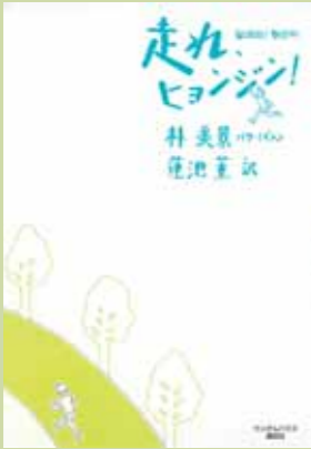
朴美景著・蓮池薫訳 ランダムハウス講談社

この本は、自閉症・発達障害の子 どもをもった韓国の母親の手記だが、 読みすすめていくうちに、障害とい うハンディを負った子どもと母親と の関わりというよりも、すべての母 と子に通じる、子育てのための本 のような気がしてくる。 「ぼく、つらいよ、ここでやめたらだ め?」 「ぼく、もう走らない」