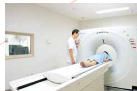
病室は、各部屋に洗面、トイレが設置されるなど、ゆとりある生活空間が保たれ、 いろいろな疾病の治療に対応できる環境となっています（4・5・6） 浴室・ヘリカルCT（7・8） 中庭に面した開放的な面会ホール（9）