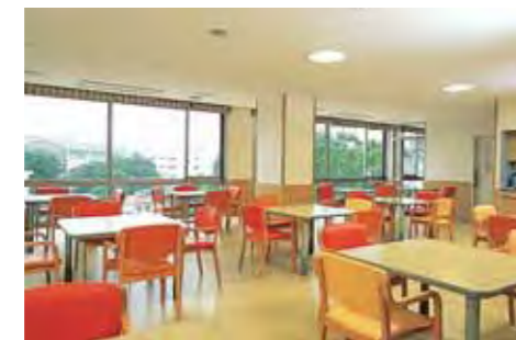
病院を訪れた緊張と不安を取りのぞき、安らぎを与える待合ロビー（1・2） 明るく眺望のよいダイニング・食堂では、快適な空間で日中をお過ごしいただけます（3）