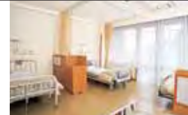
各病室には洗面、トイレが設置され、ゆとりある生活空間が保たれています