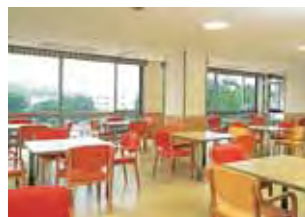
明るく眺望のよいデイルームで、入院生活を快適にお過ごしいただけます